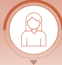
أ. منال الغزواني عضو و منسق